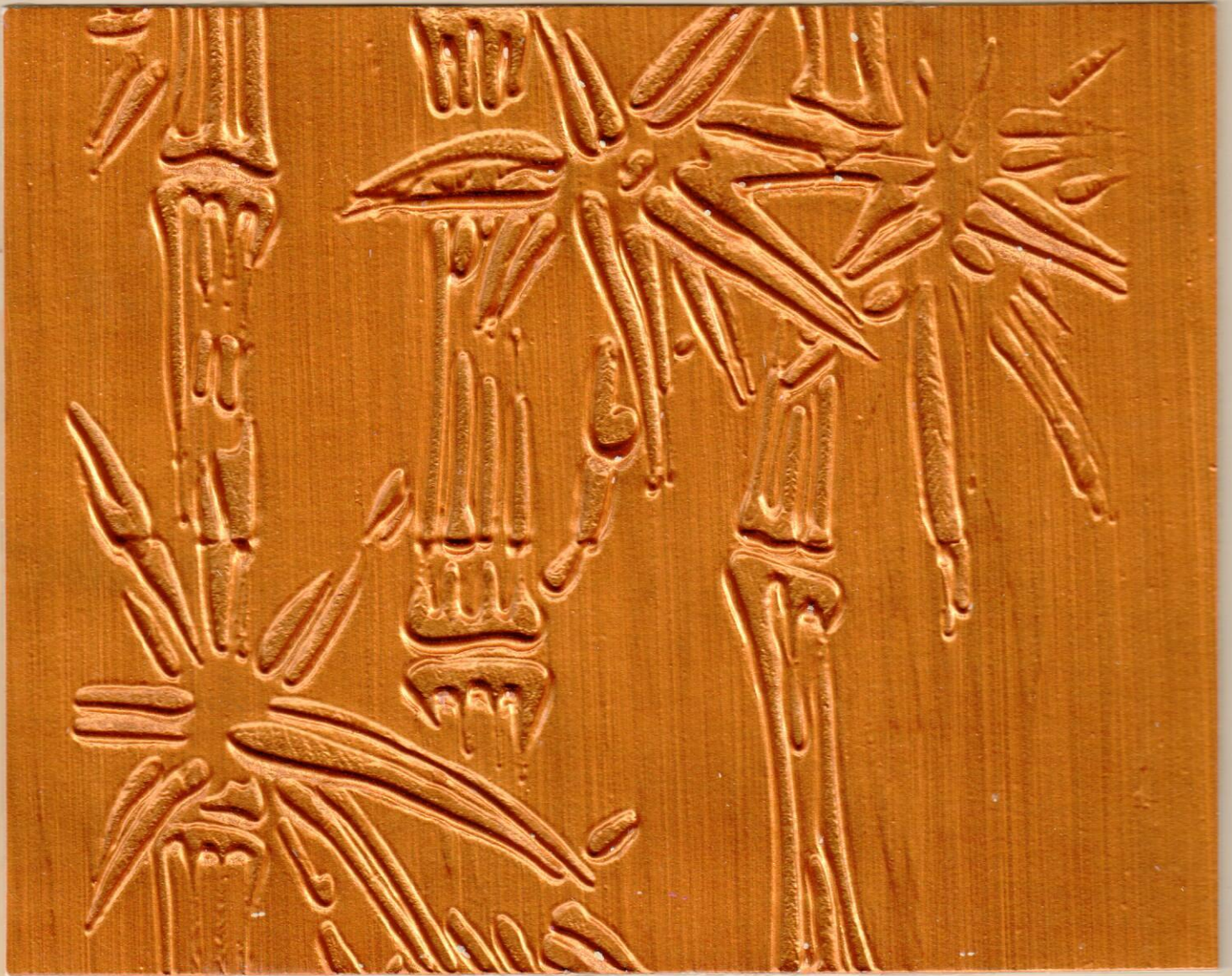
ME 305 الفرعوني S0530 Y 40R