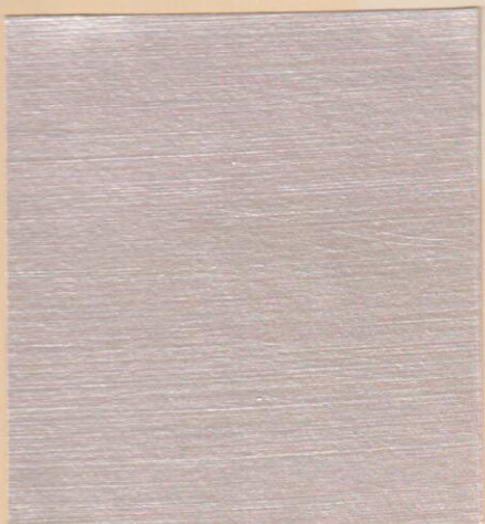
ME 151 الكادي S0520-30B