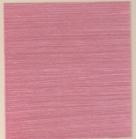
ME 452 الليلي 7143D