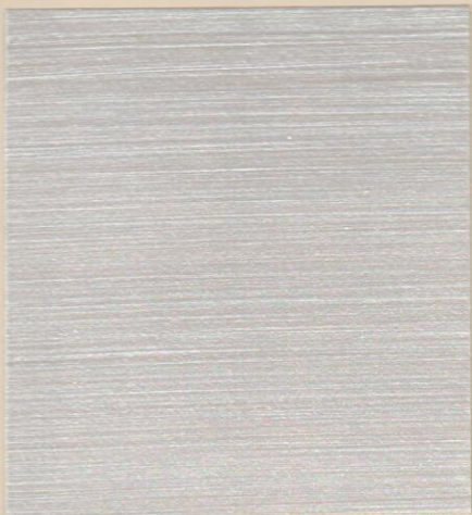
ME 8400 الياسمين S0500-N