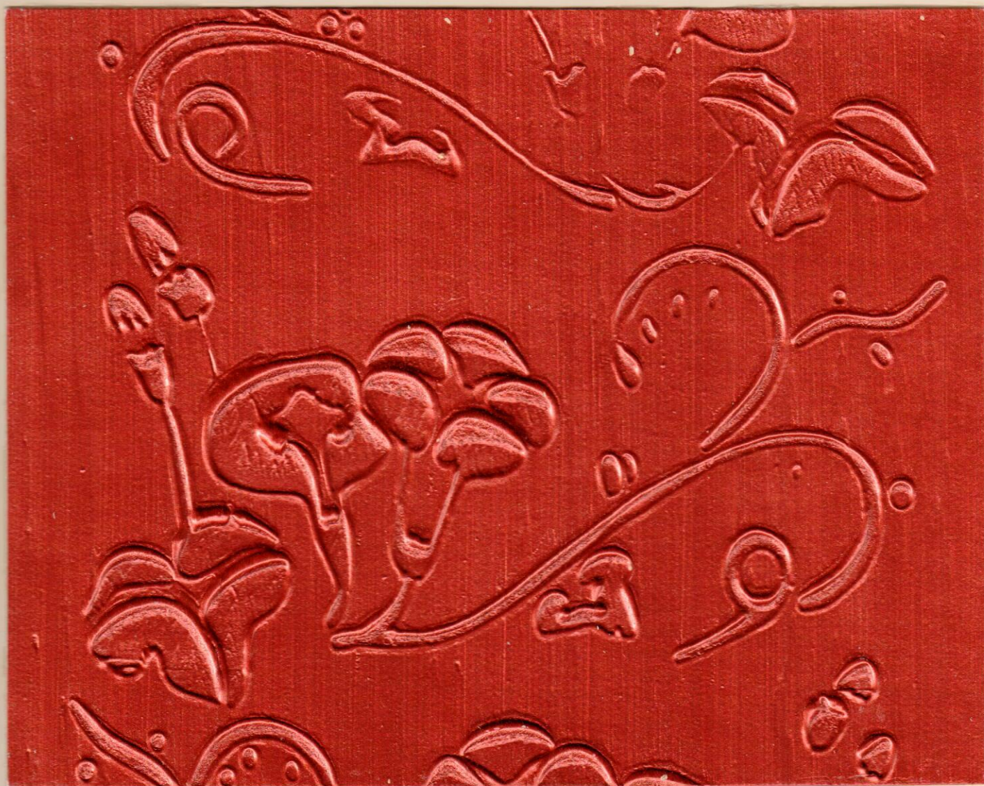
ME 532 الملكي 7143D