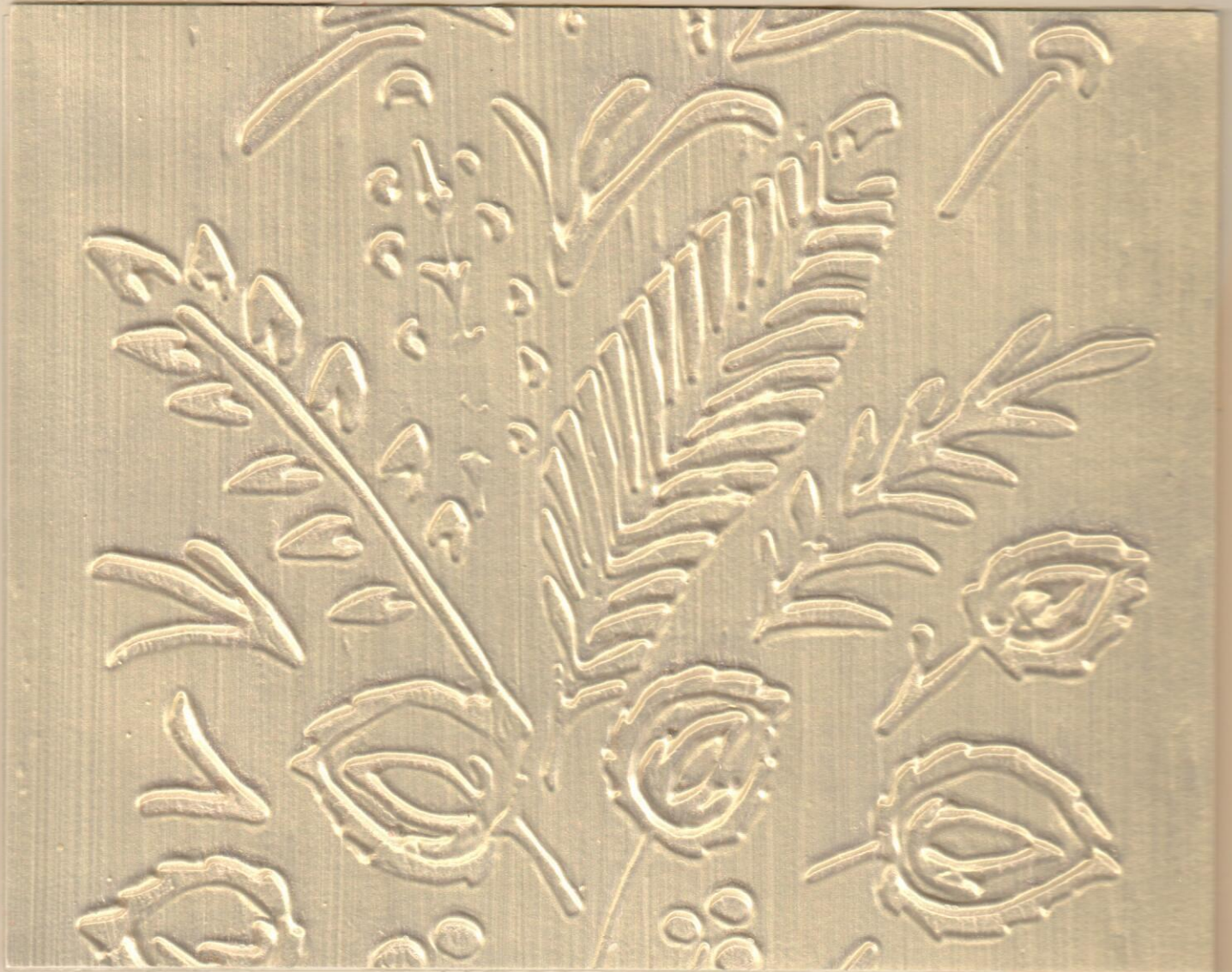
ME 205 النخبة S0520Y10R