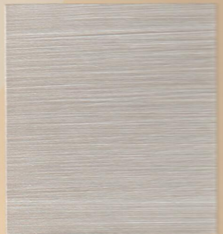
ME 100 التبراس S0500-N