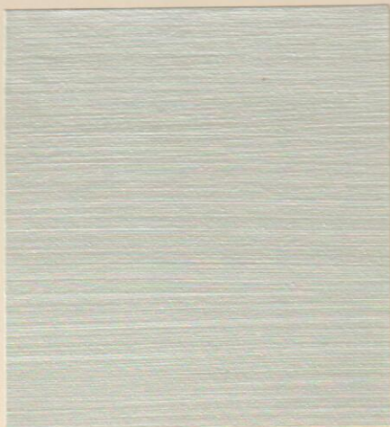
ME 120 الدانة E9 - 41